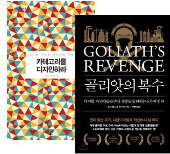
※ 본 도서는 참고 이미지입니다

‘사람’ 공부와 경영 트렌드가 교차하는 경영의 새로움 매월 1회 진행되는 12년 전통의 IGM Trend Insight도 누리세요!